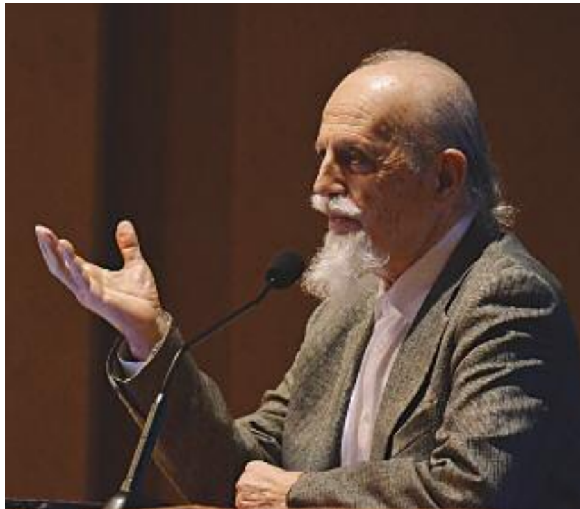
Μέγαρο Μουσικής Αθηνών

Ο συγγραφέας επιλέγει να ξεκινήσει με την ενότητα που εξετάζει τις «Κοινωνίες των ζώων» προκειμένου, όπως λέει, αφ' ενός «να υποπτευθούμε από πού ξεκινήσαμε», και αφ' ετέρου για να «μαλακώσει το πετσί μας» διά της συνειδητοποιήσεως όσων μας συνδέουν με τα μη-ανθρώπινα έμβια όντα, και έτσι να κατανοήσουμε καλύτερα τα δικά μας κοινωνικά βάσανα. Ως προς αυτό το τελευταίο, ελάχιστο απέχει από αυτό που ο Ιμμάνουελ Καντ σε ώριμη ηλικία υποστήριξε: η αδιαφορία μας για τα ζώα μπορεί να νε-